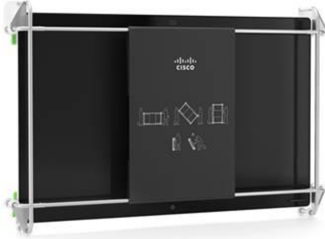
Şekil 2. Yeni Tekerlek Tabanlı Paketleme ve Nakliye Çerçevesinde Cisco Webex Kartı 85

sağlar. Sistem aynı zamanda kolay ve zengin ekip işbirliği için dokunmatik dayanır. Webex Board yalnızca kullanımı güzel ve zahmetsiz olmakla kalmaz, aynı zamanda satın alması ve kurulumu ve kurulumu kolaydır, böylece büyük konferanslarınızda ve eğitim salonlarınızda bir fikstür olabilir. Webex Board 85 ayrıca taşımayı ve montajı kolaylaştıran benzersiz bir tekerlek bazlı paketleme ve taşıma çerçevesine sahiptir.