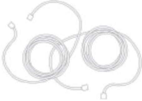
2 CAT6 Ethernet Cables

MX450'ye ek olarak, aşağıdakiler sağlanmıştır: